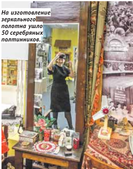
На изготовление зеркального полотна ушло 50 серебряных полтинников.

Трюмо, которое хранится в музее истории и развития Октябрьского района «Закаменка», полностью рукотворное.