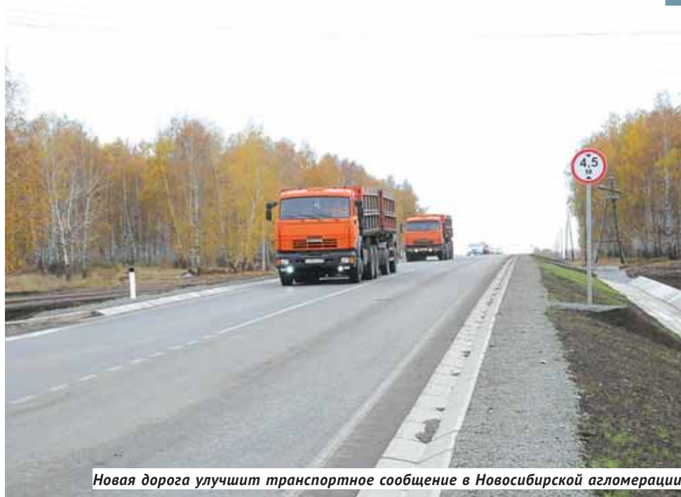
Новая дорога улучшит транспортное сообщение в Новосибирской агломерации.

Председатель комитета заксобранья по транспортной, промышлен-