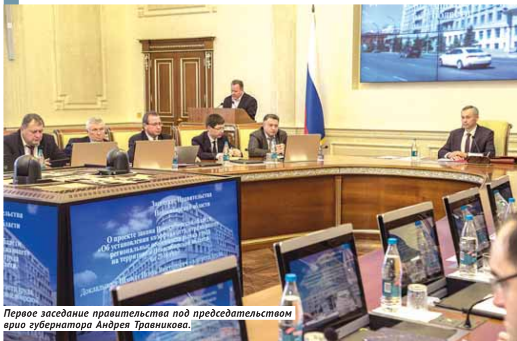
Первое заседание правительства под председательством врио губернатора Андрея Травникова.

Врио губернатора Новосибирской области Андрей Травников , назначенный на эту должность 6 октября, делает первые шаги в политическом пространстве региона.