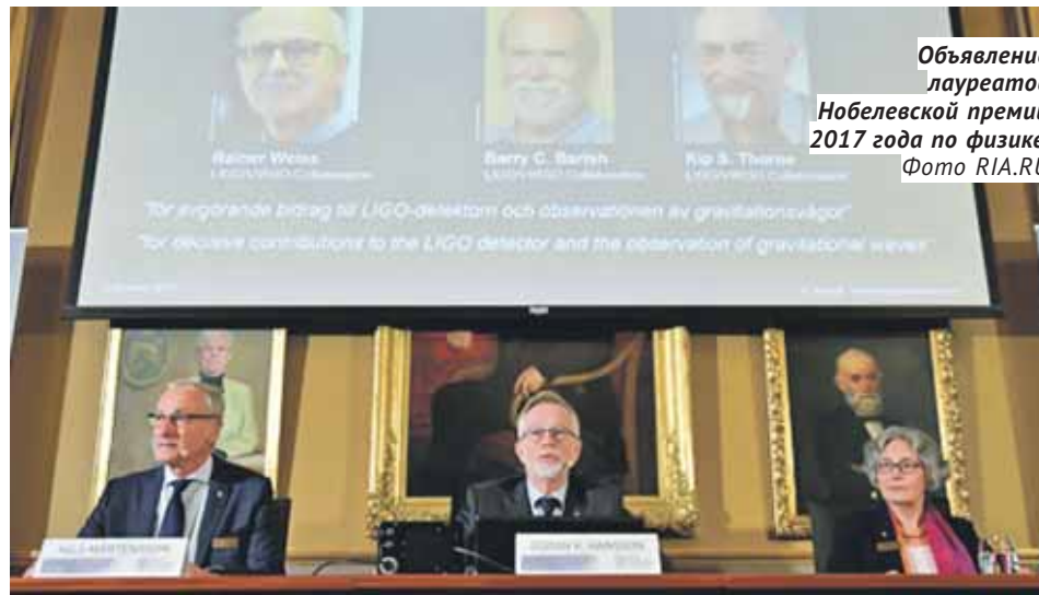
Объявление лауреатов Нобелевской премии 2017 года по физике.