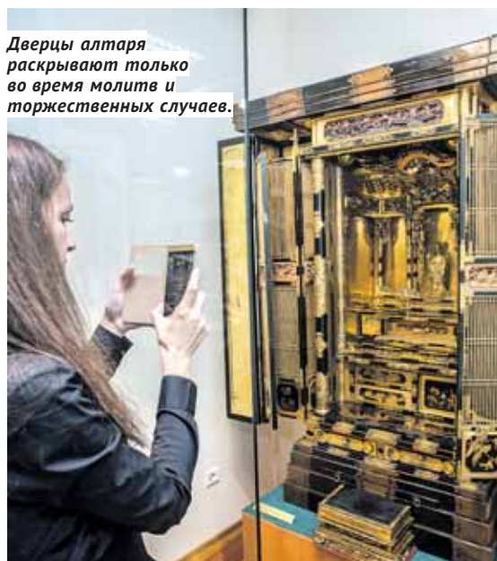
Дверцы алтаря раскрывают только во время молитв и торжественных случаев.

Особую ценность музея представляют также экспонаты, принадлежащие семье Рерихов. Например, вещи Юрия, старшего сына Николая и Елены Рерихов, — дорожный сундук, монгольский халат, кофр для фотоаппарата. С Юрием они «прошли» пятилетний маршрут (с 1923 по 1928 год) Центрально-Азиатской экспедиции. Через Индию, Китай, Россию, Монголию и Тибет. В России экспедиция проходила, в частности, через Новониколаевск и Бийск.