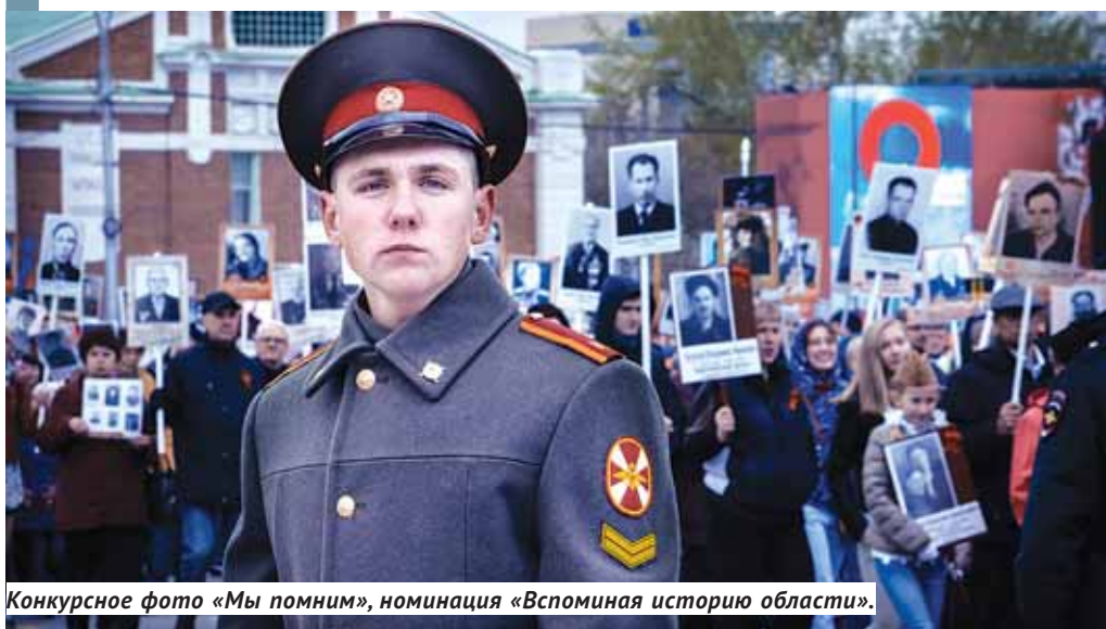
Конкурсное фото «Мы помним», номинация «Вспоминая историю области».

В ходе предварительного отбора определены потенциальные победители по четырём номинациям: «Красота родной земли», «Вспоминая историю области», «Портрет современника» и «Взгляд в будущее». По результатам рейтингового голосования к открытому публичному голосованию допущены 40 фоторабот и 12 видеороликов. Конкурсная комиссия также решила определить специальные номинации,